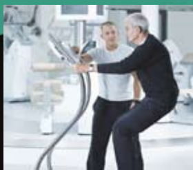
Neu: Chipkarten gesteuertes Kraft-Vibrationstraining