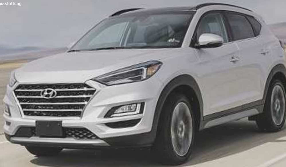
Abb. beispielhaft & zeigt Sonderausstattung.