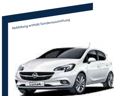
Abbildung enthält Sonderausstattung

Über 30 Fahrzeuge sofort verfügbar, zum Beispiel: